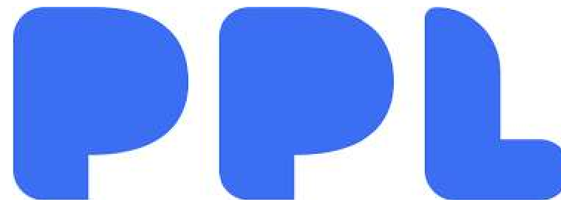
PPL - Coletivo