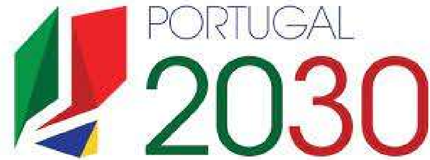
Portugal 2030 - Público